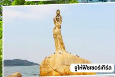
จูไห่ฟิชเชอร์เกิร์ล