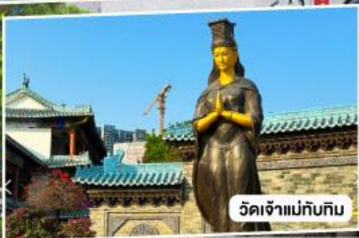
วัดเจ้าแม่กั๊กทิม