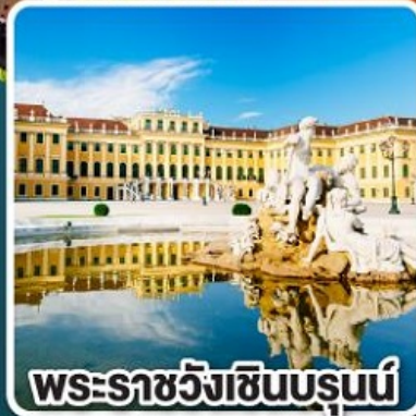
พระราชวังซินบรูนน์

บินตรงไปกลับ ด้วยสายการบินชั้นนำระดับ 4 ดาว คูปองท์ฮันซ่าและออสเตรียนแอร์ไลน์