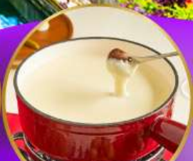
ฟองดูซีส