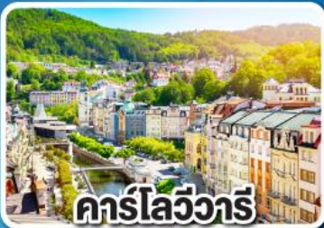
คาร์ลสไบร์