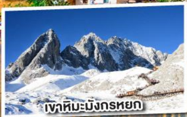
เขาสหิมะมังกรหยก