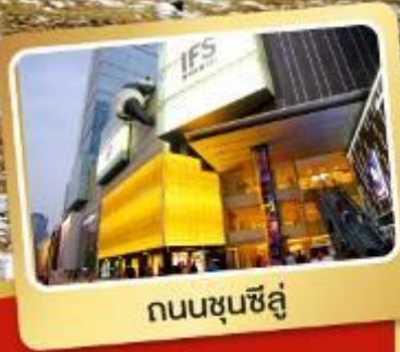
ถนนชุนชี่ลู่