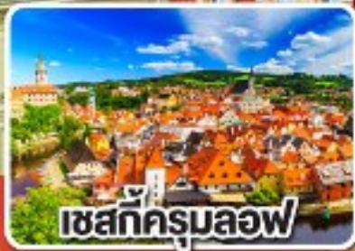
เชสกีครุมลอฟ