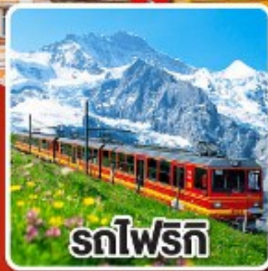
รถไฟสวิส

เที่ยวเมือง มรดกโลกเชสกีครุมลอฟ เพชรเม็ดงามแห่งโบฮีเมีย