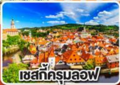
เชสท์ครุมลอฟ