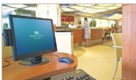
Internet Café & Library