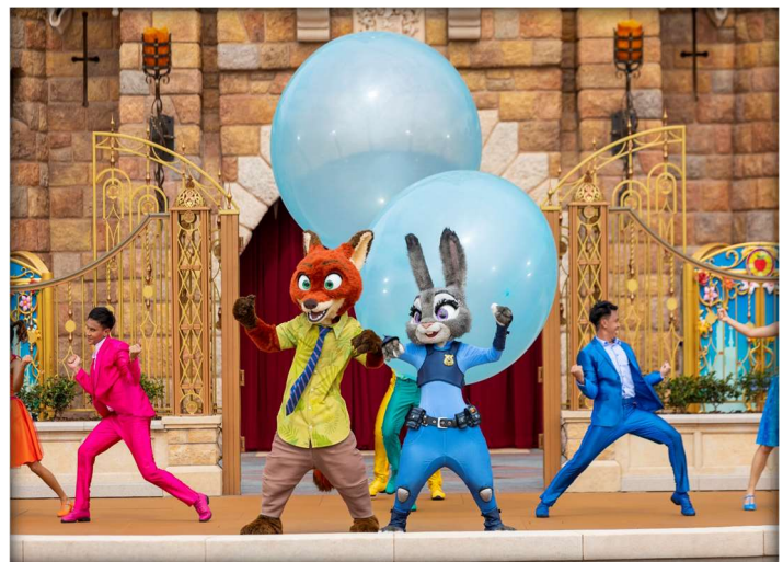
GO1HKG-EK034 ฮ่องกง เสริมพลังหมกัณฑ์นำโชค 3 วัน 2 คืน โดยสายการบิน Emirates (EK)