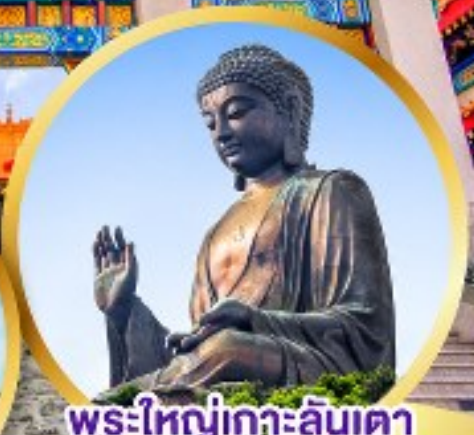
พระใหญ่เกาะลันเตา