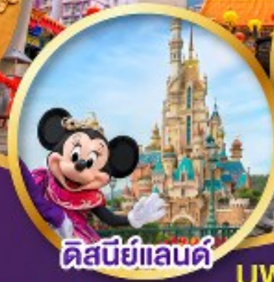
ดิสนีย์แลนด์