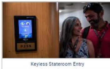
Keyless Stateroom Entry