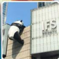
แพนด้ายักษ์ป็นตึกIFS