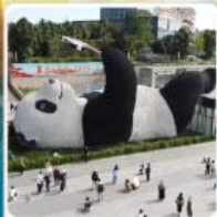
รูปปั้นแพนด้าเซลฟ์