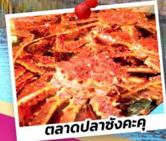
ตลาดปลาซังคะคุ