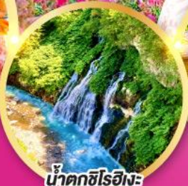
น้ำตกชิโรอิเงะ