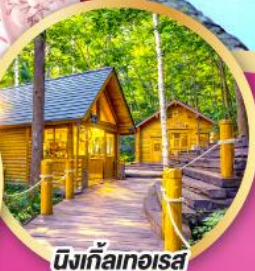
มิงก้าไกเออสะ