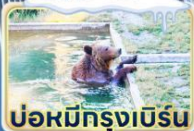
บ่อหมีทรงเบริน