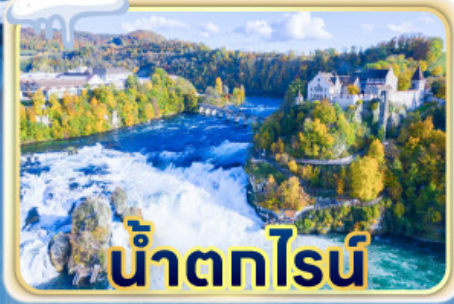
น้ำตกไรน์