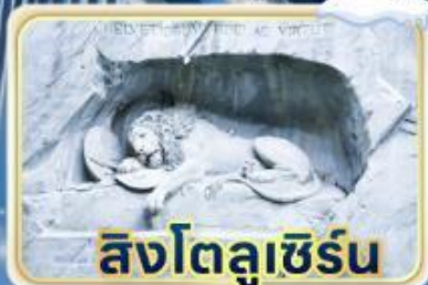
สิงโตลูเชิร์น