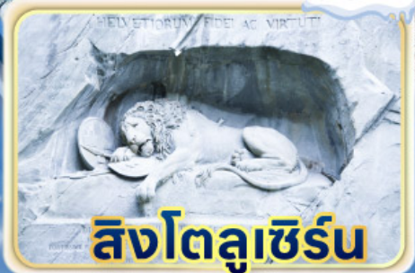
สิงโตลูเซิร์น