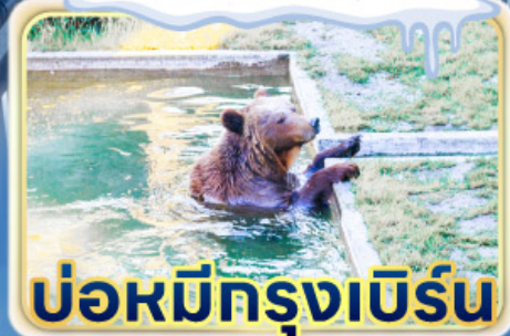
บ่อหมีกรุงเบิร์น