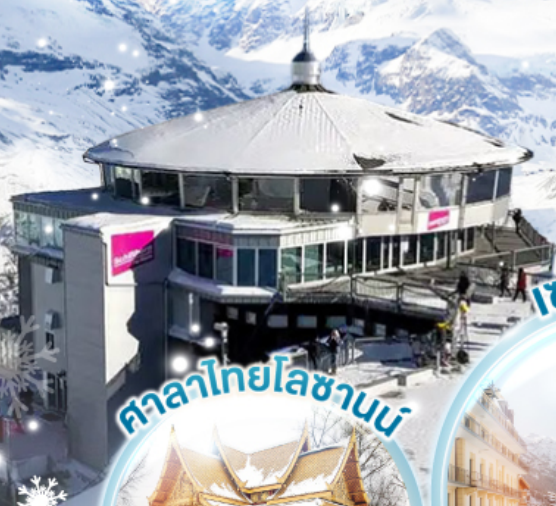
ศาลาไทยโลซานน์