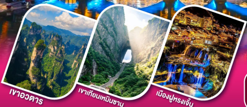
เจาอวตาร