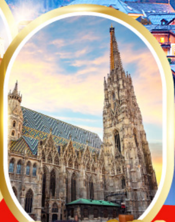
มหาวิหารเซนต์สตีเฟน