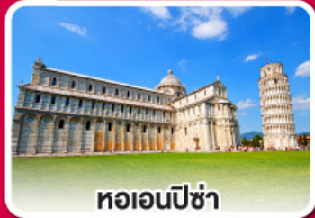
หอเอนปิซ่า