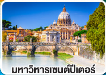
มหาวิหารเซนต์ปีเตอร์