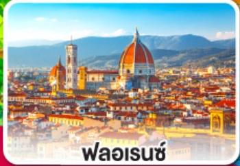
ฟลอเรนซ์

จะพาस्ता, พิซซ่า หรือสปาเก็ตตี้ คงจะดีถ้าได้กินกับเธอ