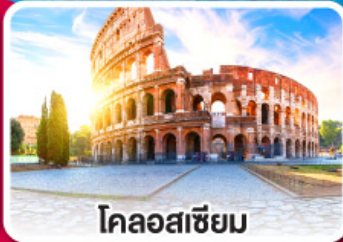
โคลอสเซียม

ลิ้มรสพาस्ता พิซซ่า และสปาเก็ตตี้ แบบต้นตำหรับอิตาลีเลียน