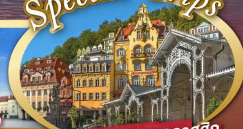
ชมสถาปัตยกรรมคลาสสิก เมือง คาร์โลวี วารี