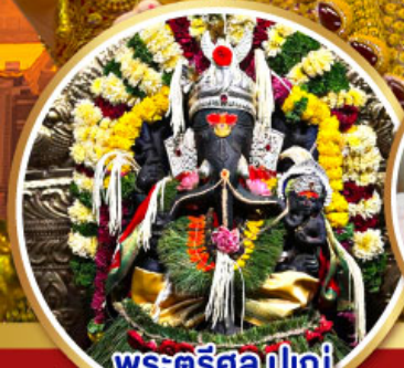
พระตรีศูล ปูणे (Trishul Pune)