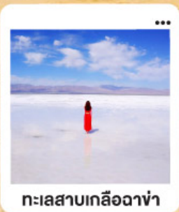
ทะเลสาบเกลือฉางซ่า