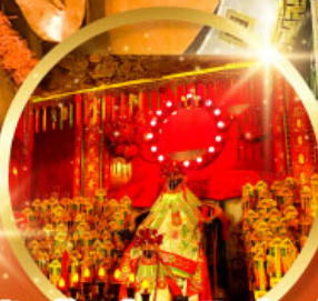
วัดเจ้าแม่กวนอิมฮ้องอำ