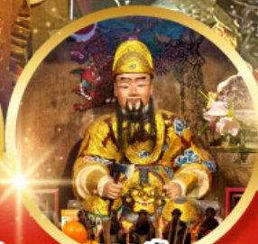
วัดแซกง 600 ปี หยุ่นหลอง