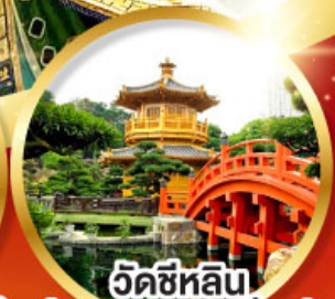
วัดซีหลิน