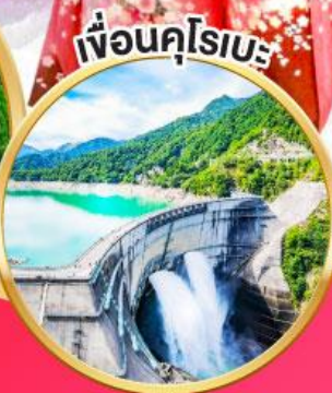
เพื่อนคูโรเบะ