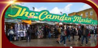
ตลาดแคมเดน