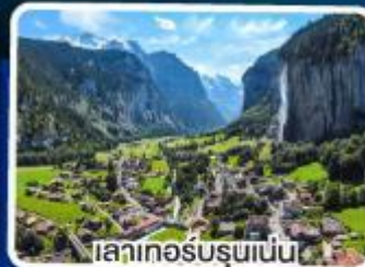
เลาเกอร์บรุนเนน