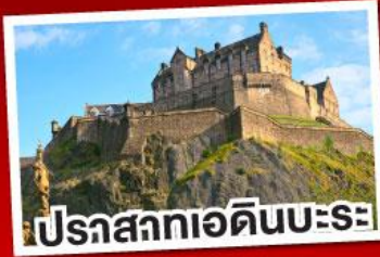
ปราสาทเอดินบะระ