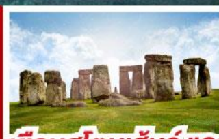
เยือนสโตนเฮ็นจ์ และ พิพิธภัณฑน์โรมันบาร