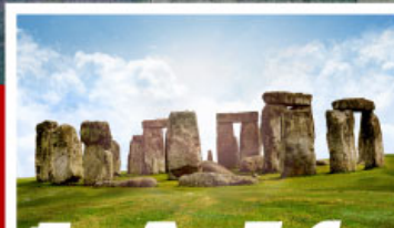
เยือนสโตนเฮ็นจ์ และ พิพิธภัณฑน์โรมันบาส