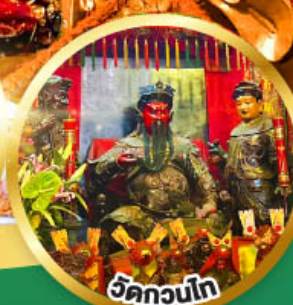
วัดกวนโก