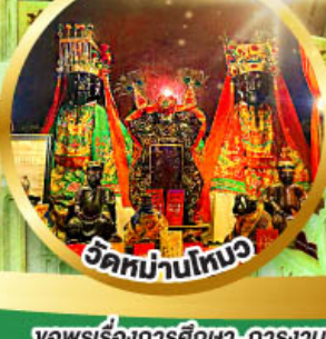
วัดบ้านโท้ว

ขอพรเรื่องการศึกษา, การงาน สติปัญญาและความกล้าหาญ