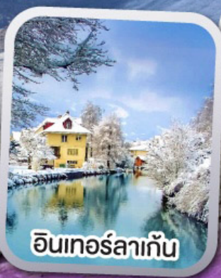
อินเทอร์ลาเก้น