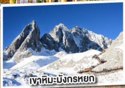
เขาสหิมะมังกรหยก