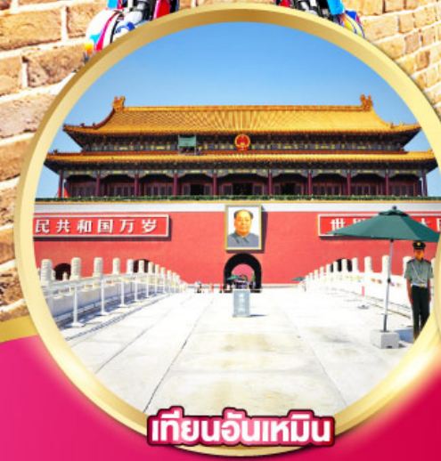
เทียนอันเหมิน