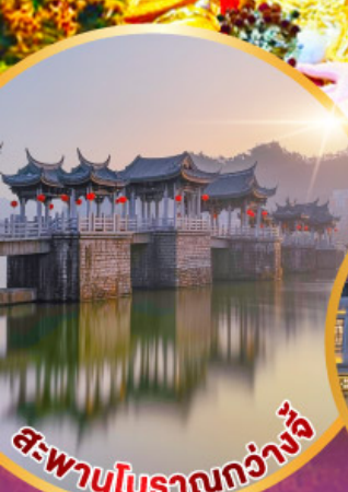
สะพานโบราณกว้างจุ