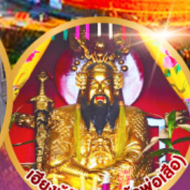
เมืองบูฉิว (ศาลเจ้าพ่อเสือ)

เมนูพิเศษ!! อาหารแต่จิว 18 อย่าง ห้ามพลาด! ไม้ต้นตำรับชิวเกา สุกชีฟู๊ด