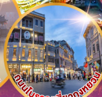
ถนนโบราณสี่วงกทอง