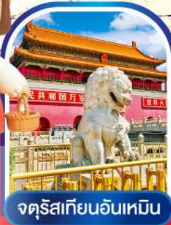
จัตุรัสเทียนอันเหมิน