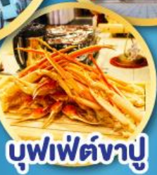
บุฟเฟ่ต์จางู