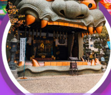
ศาลเจ้านิมบะ ยาชากะ