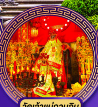
วัดเจ้าแม่กวนอิม ย่องฮ่า