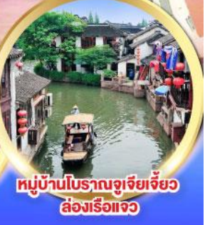
หมู่บ้านโบราณจูเจียเจี้ยว ล่องเรือแจว