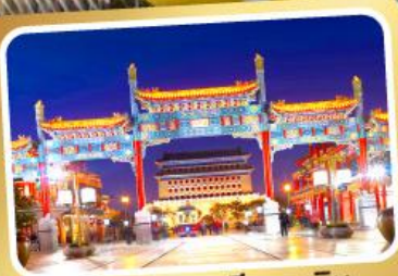
ถนนโบราณเทียนเหมิน