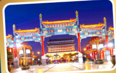
ถนนโบราณเทียนเหมิน