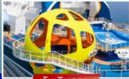
วันเดินทาง