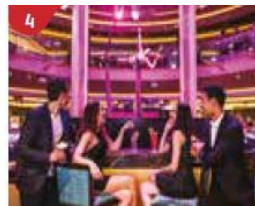
4 Bar 360 Catch live music and aerial acrobatic performances with a glass of champagne.