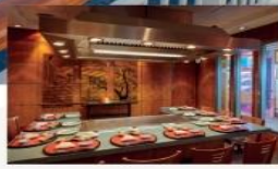
Umi Uma Sushi & Teppanyaki Signature Japanese dishes