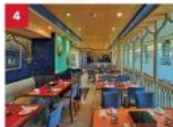
Hot Pot Enjoy your favourite noodles with an extensive list of beverages available to complement your dinner.