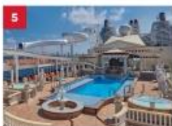
Parthenon Pool Go for a dip in our outdoor Roman-themed pool deck with Caesar's Slide, hot tubs, a stage for live bands and a mega LED screen.