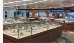
The Boutiques International duty-free shopping