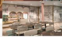
The Little Cake Café Decadent cakes and artisanal chocolates