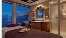
Spa Private treatment rooms, reflexology lounge and saunas