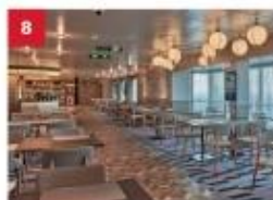
Mozzarella Ristorante & Pizzeria For adventurous foodies, savour a modern fusion of classic Italian dishes and pizzas with a Japanese twist.