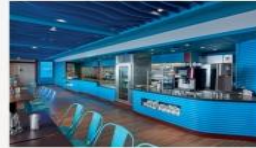
Blue Lagoon Delicious hawker food with Asian and International classics