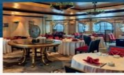
Silk Road Traditional Dim Sum and Cantonese cuisine