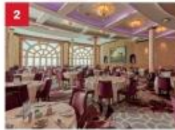
Dream Dining Room Savour Chinese and Western cuisine in our elegant main inclusive dining room.