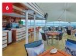
Seafood Grill Enjoy your favourite outdoor hot pot dining with a wide selection of meats, seafood or vegetarian options, paired with an extensive beverage list.