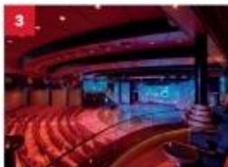
Zodiac Theatre Catch a signature production live show in our opulent theatre.