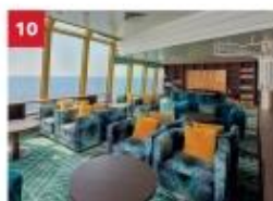
Palm Court Relax in our sophisticated observatory lounge as you enjoy sweeping ocean views.