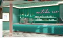
Matcha Ice Popular Matcha ice cream and Taiwan milk tea