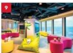
Little Dreamers Club Feed your children's imaginations with games, workshops, costume parties and even a DJ booth at our kids-only club.