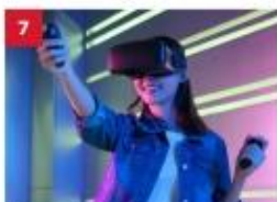
ESC Experience Lab Experience the latest in virtual and augmented reality technology for non-stop thrills.