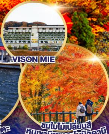
ชมใบไม้เปลี่ยนสี หุบเขามิชูซาวะโมมิจิดานิ