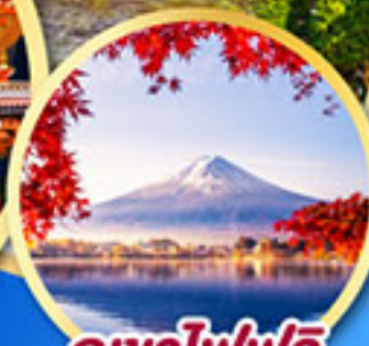
ภูเขาไฟฟูจิ