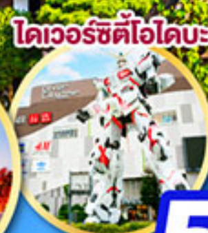
โดเวอร์ซิตีไอบะ