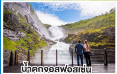
น้ำตกจอสฟอสเซ่น