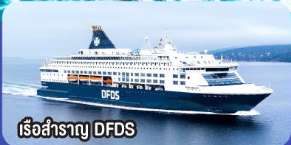
เรือสำราญ DFDS