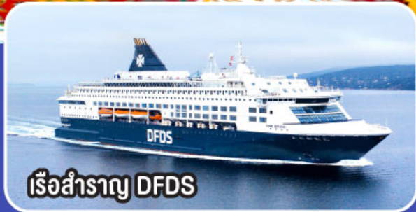
เรือสำราญ DFDS