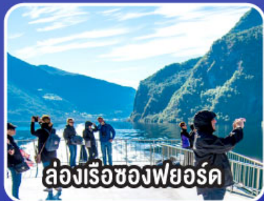
ล่องเรือช่องฟยอร์ด