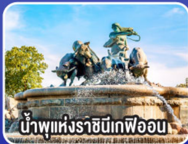
น้ำพุแห่งราชินีเกฟิออน