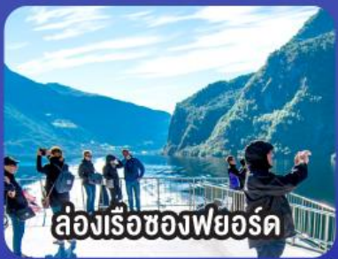
ล่องเรือช่องฟยอร์ด