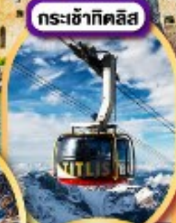
กระเช้ากิตติส