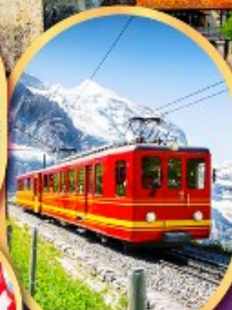
รถไฟคู่ ยอดเขาจุงเฟรา