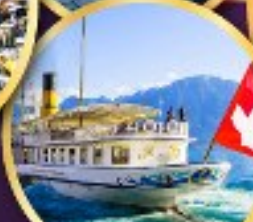
ส่องเรือ ทะเลสาบเจนีวา