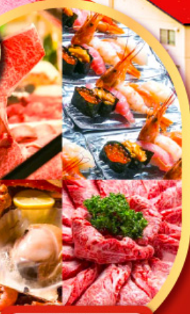
พิเศษ!! บุฟเฟ่ต์ร้าน NANDA ดีที่สุดในซัปโปโร