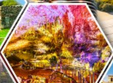
ลำไฟมิริอัส