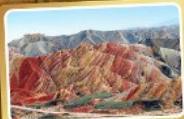
เวาสายรุ้งจางเย่