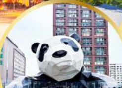
หมีแพนด้าป็นตึก