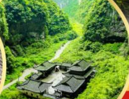
หลุมฟ้าสะพานสวรรค์