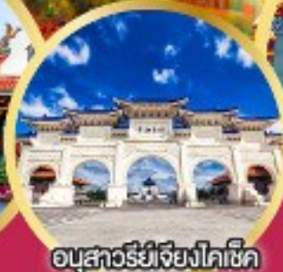
อนุสาวรีย์เจียงไคเช็ค