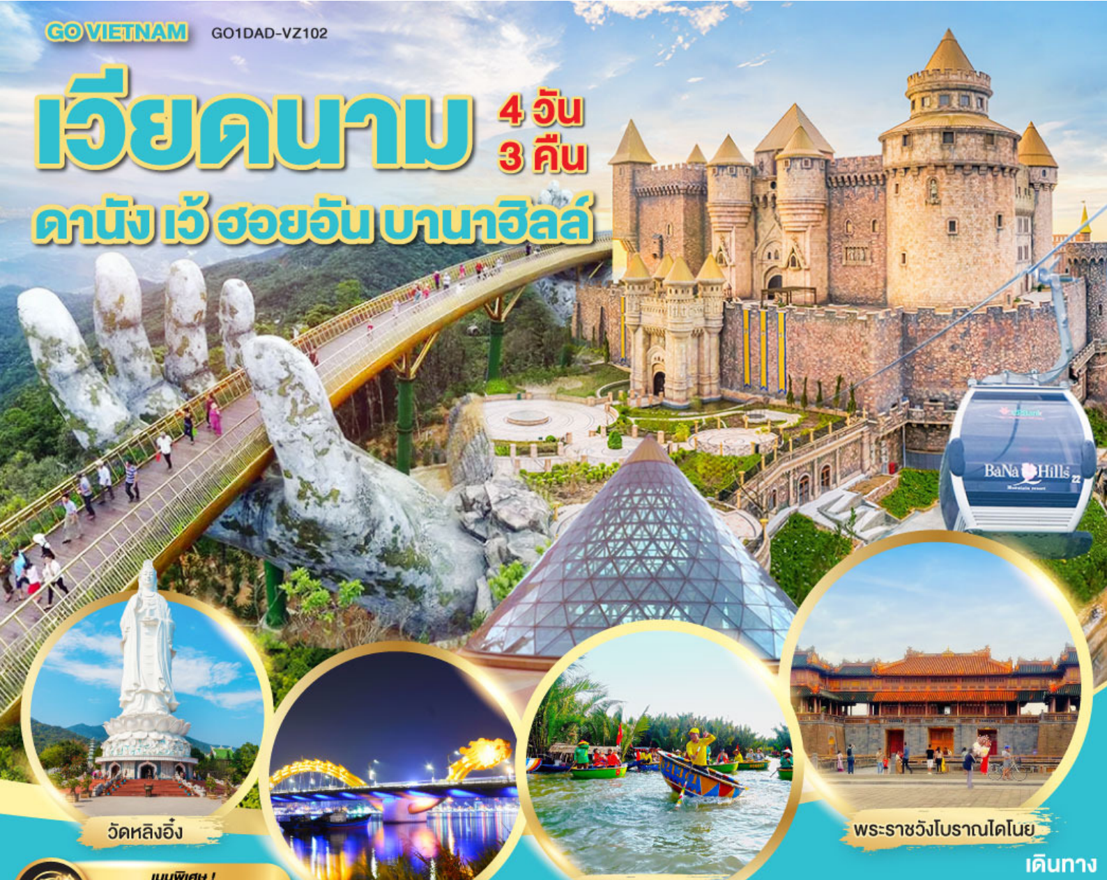
วัดหลังอิง